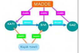
Şekil 1. Örnek bir kavram haritası

=> Kavramlar ve kavramlar arası ilişkileri gösteren grafiksel bir görsel araçtır .